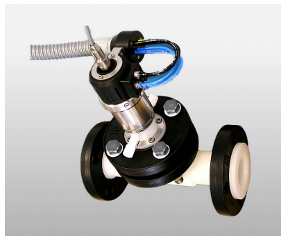
Installation an EXtract820 mit Durchflussgefäß EXflow720