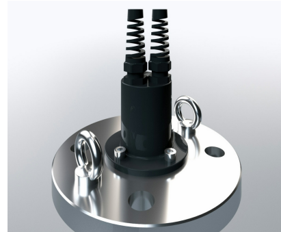
Flansch in DIN oder ANSI-Größen