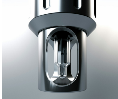
Schutzkorb mit integrierter Orbitalspülung