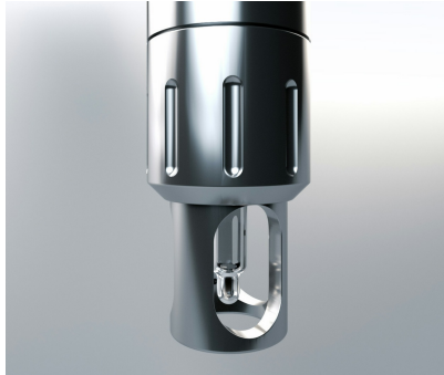
Schutzkorb und Überwurfmutter für den Aus- und Einbau des Sensors